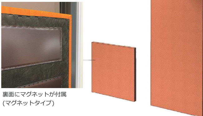
裏面にマグネットが付属(マグネットタイプ)