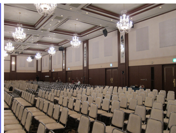
セミナー/懇親会場の音改善