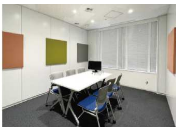
会議室のスチール壁に

「小さな声」で会話することによって声漏れを防ぐ、まったく新しい防音のスタイルです。