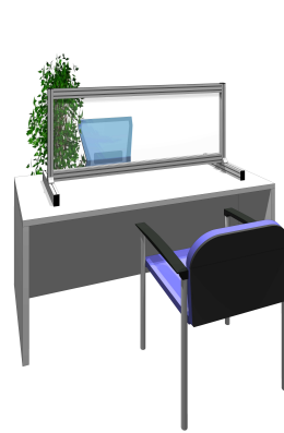
ローカウンターや食堂に