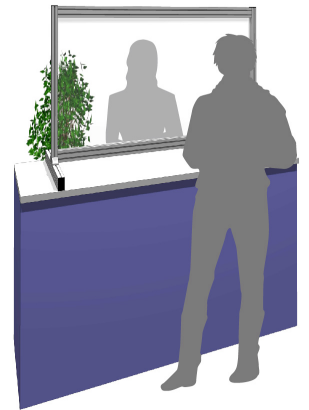
受付カウンターに