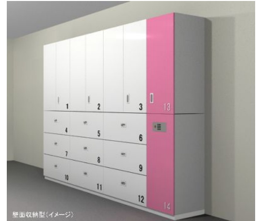
壁面収納型(イメージ)

扉を開けるには個人コードとあらかじめ設定した暗証番号の入力が必要です。さらに「Aさんは1と2の扉のみ、Bさんは3と4の扉のみ、管理者Cさんは1～4の扉すべて」というように各々開けられる扉をあらかじめ設定することができます。